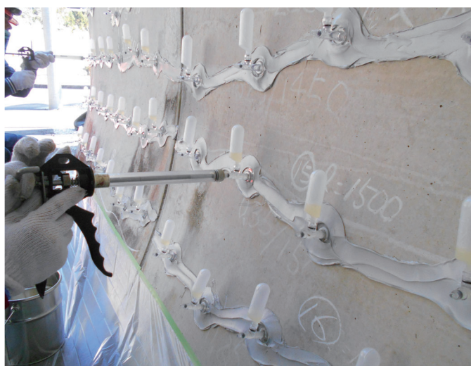
土木構造物 改修 トンネル内壁