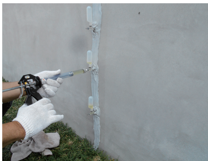
建築構造物 新設 腰壁

コンクリート構造物の挙動があるひび割れ、モルタルやタイルの浮き等の注入・充填接着に適しています。ひび割れ注入は、自動式低圧エポキシ樹脂注入工法 (SK グラウトプラグ A 工法) により微細なひび割れに対し優れた注入性と追従性と接着性が期待できます。