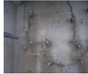
ひび割れシール・プラグ取