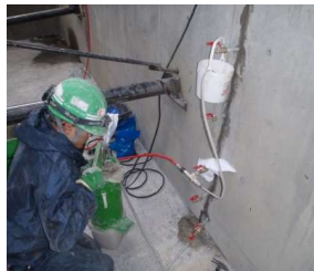
ひび割れ注入状況