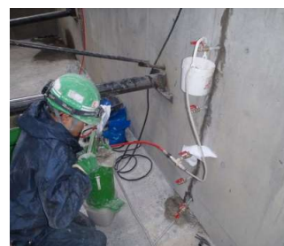
ひび割れ注入状況