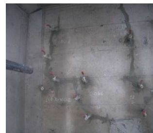
ひび割れシール・プラグ取付