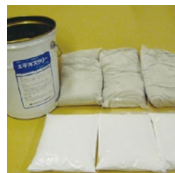
荷姿: 19.2kgベール缶 (4 \times 3セット入り)