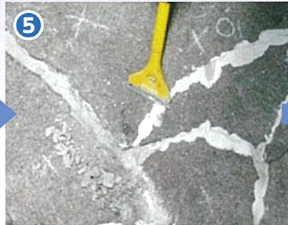
⑤ 硬化確認後、余分な所をケレン、清掃する