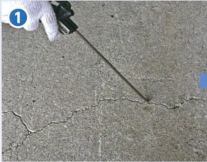
① ひび割れを掃除機、ブロワ等で清掃する