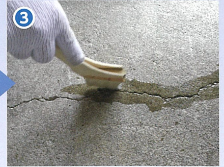
③ ひび割れを十分に水湿する