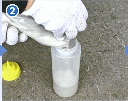
② 容器に水と添加剤を入れよく振ってから、主材1袋を加えよく振って攪拌する。