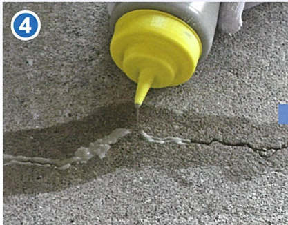
④ 材料を流し込む ひび割れ幅が大きく材料が下に沈む場合は再度流し込む