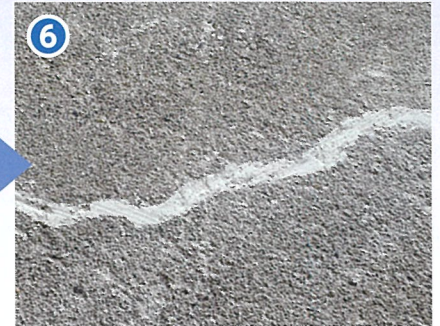
⑥ ひび割れ充填完了